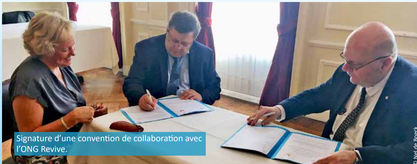
Signature d'une convention de collaboration avec l'ONG Revive.

De nouveaux partenariats, à l'image de celui qui nous lie avec l'ONG médicale MEDICAERO, viennent renforcer notre stratégie de niche qui vise à établir de petits écosystèmes avec les acteurs de la santé confrontés à des situations complexes mêlant urgence et développement dans des régions très enclavées en situation de crise humanitaire, cela en leur fournissant un appui aérien local sur mesure.