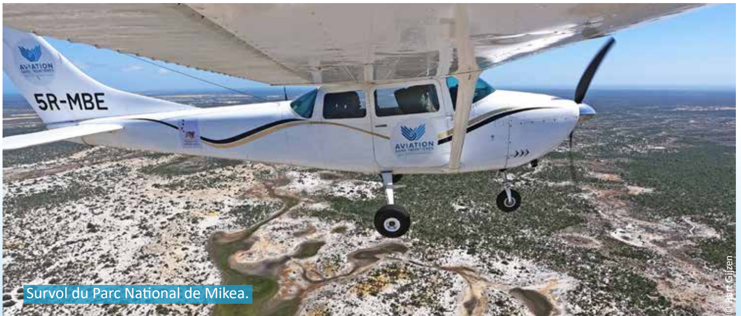
Survol du Parc National de Mikea.