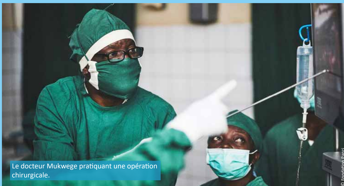
Le docteur Mukwege pratiquant une opération chirurgicale.

Ainsi, une convention a été signée avec l'ONG médicale REVIVE basée à Gand et pratiquant la chirurgie à Madagascar, et un partenariat stratégique est en train de se mettre en place avec la Fondation PANZI et la Fondation Dr MUKWEGE, Prix Nobel de la Paix 2018. Il s'agit de la mise en place d'un appui aérien local et ponctuel au service des équipes médicales de l'hôpital de PANZI intervenant dans le Sud-Kivu et les provinces adjacentes auprès des femmes victimes des viols utilisés comme arme de guerre.