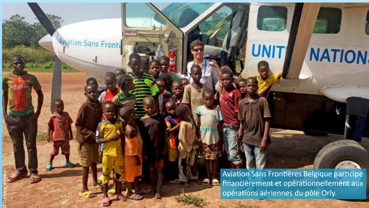
Aviation Sans Frontières Belgique participe financièrement et opérationnellement aux opérations aériennes du pôle Orly.

Les sections ASF peuvent donc aujourd'hui diversifier leurs activités et leurs thèmes de sensibilisation du public en participant financièrement et opérationnellement aux projets des unes et des autres.