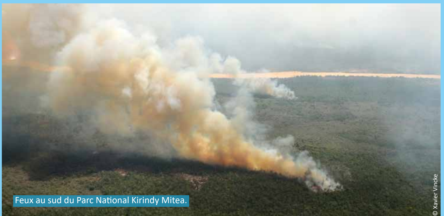
Feux au sud du Parc National Kirindy Mitea.