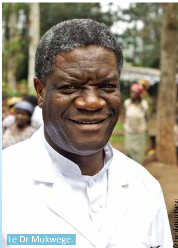
Le Dr Mukwege.