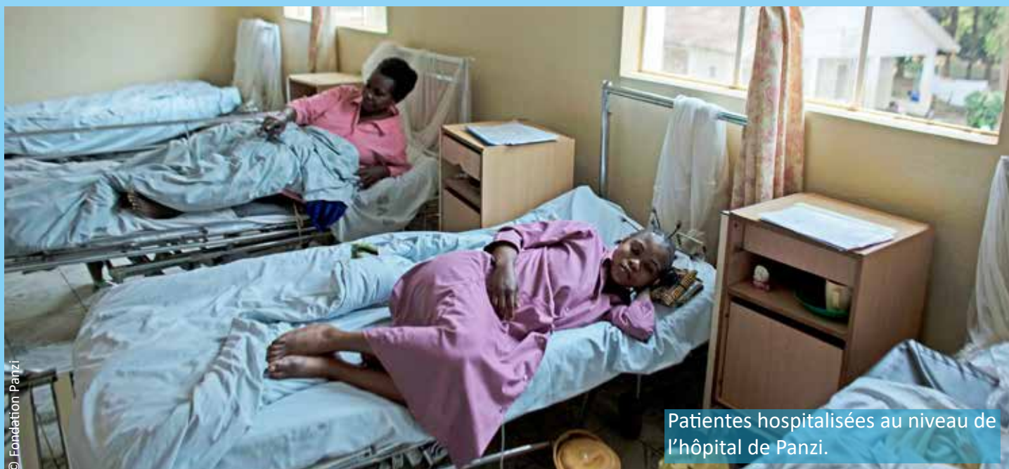
Patientes hospitalisées au niveau de l'hôpital de Panzi.

Le Dr MUKWEGE fait connaître au monde la barbarie sexuelle dont les femmes sont victimes à l'Est de la République démocratique du Congo où le viol collectif est utilisé comme arme de guerre. Il lutte au péril de sa vie pour mettre fin à cette pratique. Pour son engagement dans la lutte contre l'utilisation des mutilations sexuelles comme arme de guerre et pour son dévouement envers les victimes de ces actes, le Dr MUKWEGE a reçu diverses récompenses, dont les suivantes :