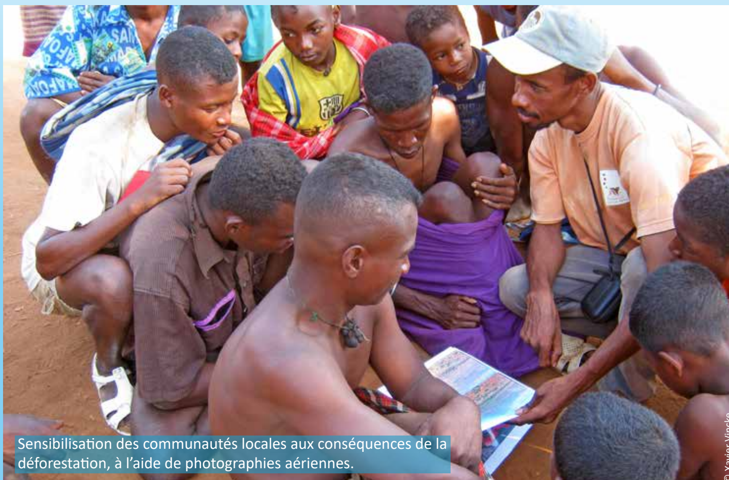
Sensibilisation des communautés locales aux conséquences de la déforestation, à l'aide de photographies aériennes.

Pour répondre à cette menace, la méthodologie de photographie aérienne oblique pour la surveillance aérienne des aires protégées a été développée par Aviation Sans Frontières - Belgique, en collaboration avec ses partenaires locaux comme le WWF Madagascar. Depuis 2010, cette méthodologie simple, économique et d'une rigueur scientifique avérée permet de lutter contre la déforestation tout en impliquant les communautés locales dans la sauvegarde de leur patrimoine naturel, au bénéfice des générations futures. Elle s'inscrit de la sorte dans une démarche de développement durable et de prévention des crises humanitaires à venir.