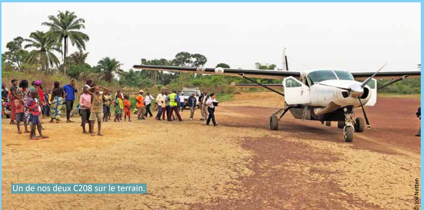
Un de nos deux C208 sur le terrain.

Au total, 1 841 heures de vol ont été effectuées à partir des bases de Bangui (République centrafricaine) et de Bunia (République démocratique du Congo).