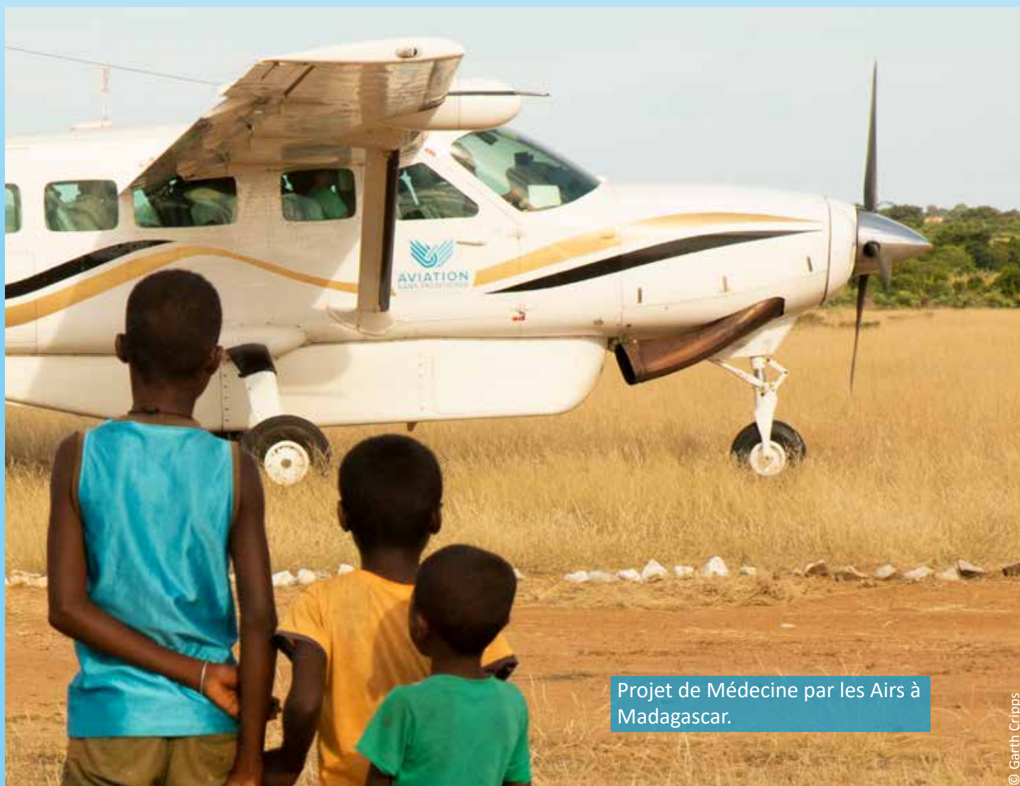
Projet de Médecine par les Airs à Madagascar.